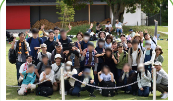
行事<デイキャンプ>

学校・関係機関等に向けて、研修会の開催や、相談に応じます。 児童相談所と協力して、児童養護施設の児童を対象にしたグループセラピーも行います。