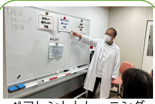
ペアレントトレーニング