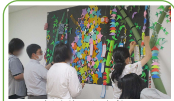
園内活動<七夕飾り>