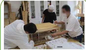
園内活動<ものづくり>