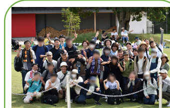
行事＜デイキャンプ＞

学校・関係機関等に向けて、研修会の開催や、相談に応じます。 児童相談所と協力して、児童養護施設の児童を対象にしたグループセラピーも行います。