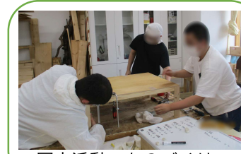
園内活動＜ものづくり＞