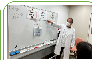
ペアレントトレーニング