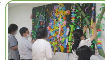
園内活動＜七夕飾り＞