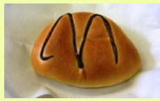
チョコクリームパン