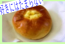
カマンベールパン