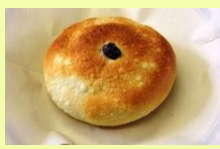
ブルーベリージャムパン