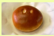
クリームレモンパン