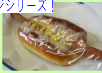
粒からしソーセージパン