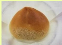
あまぐりあんパン