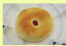
いちごジャムパン