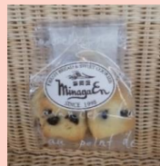
チョコチップクッキー