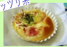
ベーコンチーズパン