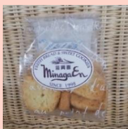
アーモンドクッキー